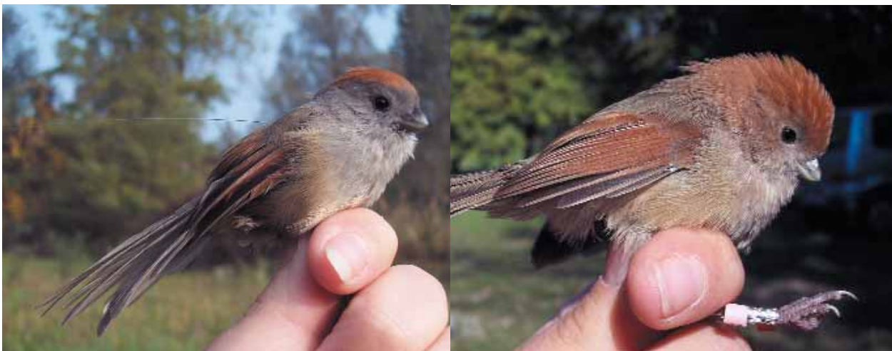
A sinistra, uno dei panuri dotati di trasmettente. Gli individui sono stati marcati anche con anelli colorati per renderne possibile il riconoscimento a distanza. Notare le guance grigie dell'esemplare a sinistra in confronto alle rosse di quello di destra (Federica Luoni)

Il numero di catture è variato nel corso degli anni, apparentemente in dipendenza dell'an-